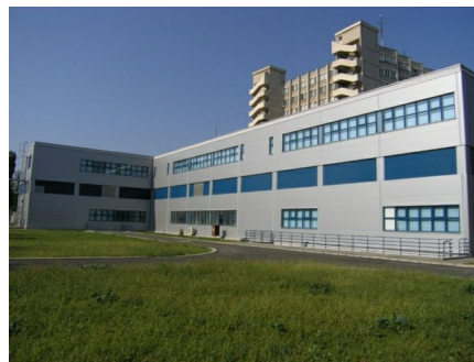
Foto 2, a,b. Centrul de Excelență în Neurochirurgie de la Spitalul Clinic de Urgență Bagdasar-Arseni, București.