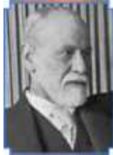
Sigismund Schlomo Freud (1856-1939)