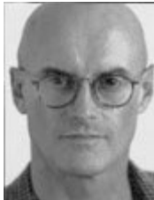
Kenneth Earl Wilber II (born 1949) Integral Institute The Spectrum of Consciousness (1977)