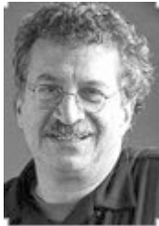
Robert Kegan (born-1946) Harvard Graduate School of Education The Evolving Self (1982)