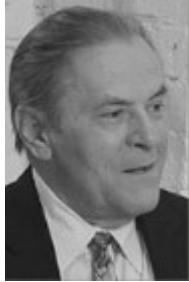
Stanislav Grof (born-1931) Esalen Institute, California Holotropic Breathwork: A New Approach to Self-Exploration and Therapy (2010)