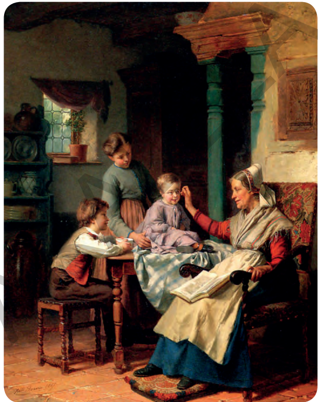
Încercând ochelarii bunicii , Théodore Gérard (1829–1902)