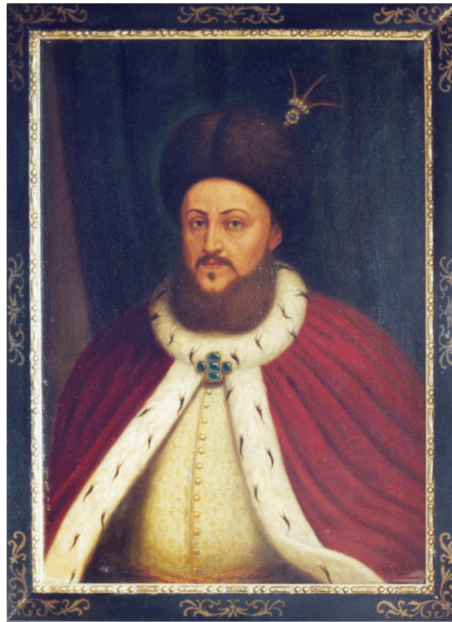
ALEXANDRU MAVROCORDAT EXAPORITUL, DOMNITOR AL ȚĂRII ROMÂNEȘTI (1715 -1716, 1719 – 1730)