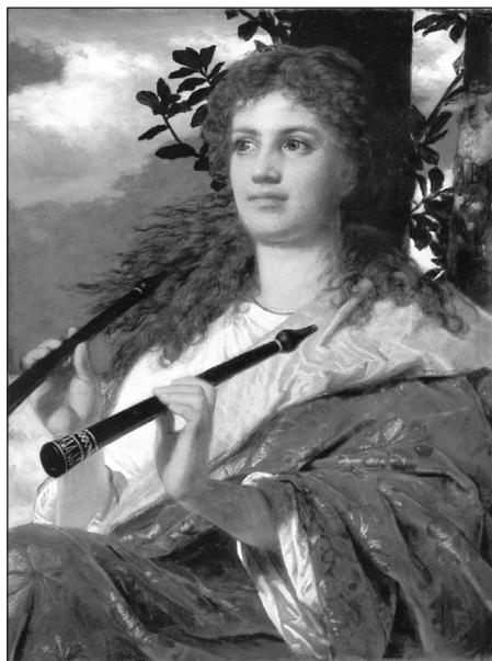
Arnold Böcklin, Muza lui Anacreon (1873)

Symbolismul revoluționează conceptul clasic al poeziei, reevaluând raporturile dintre cele două arte. Literatura tinde, după Mallarmé, să „reia din muzică bunul ei”, căutând sugestia, vagul, armonia imitativă, cultivând refrenul, leitmotivul, rima interioară, asociațiile sonore, symbolismul fonetic etc. Liberă de orice constrângeri, poezia încearcă o apropiere de muzică și la nivel prozodic (versificație liberă).