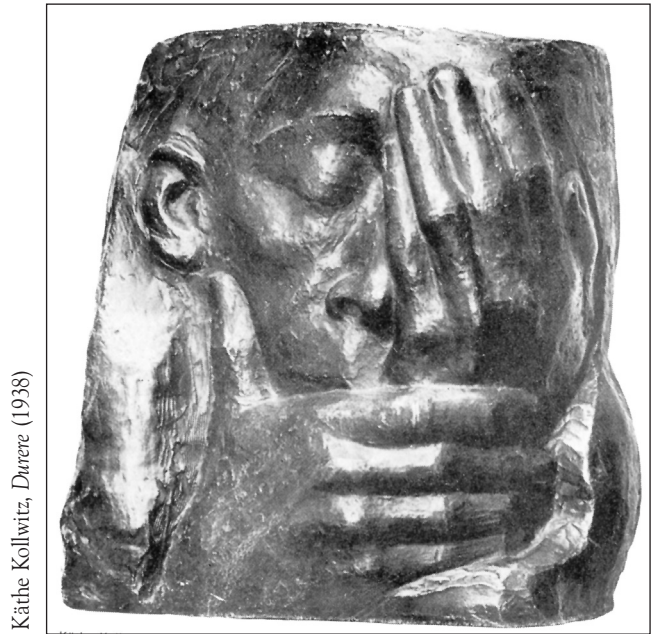
Käthe Kollwitz, Durer (1938)

tensiuni ale forțelor absolute ce acționează sugestiv asupra straturilor preraționale, făcând să vibreze totodată și zonele de mister ale noțiunilor” (Hugo Friedrich, Structura liricii moderne , Editura Univers, București, p. 205).