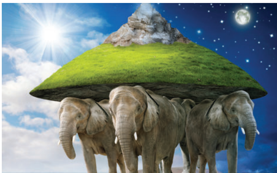
Fig. 1.2 Indienii credeau că Pământul este plat ca o farfurie și este purtat pe spate de elefanți.

Fizica este o știință în permanentă evoluție. Cu toții ne schimbăm modul în care vedem și judecăm lumea înconjurătoare, pe măsură ce cunoștințele de fizică avansează.