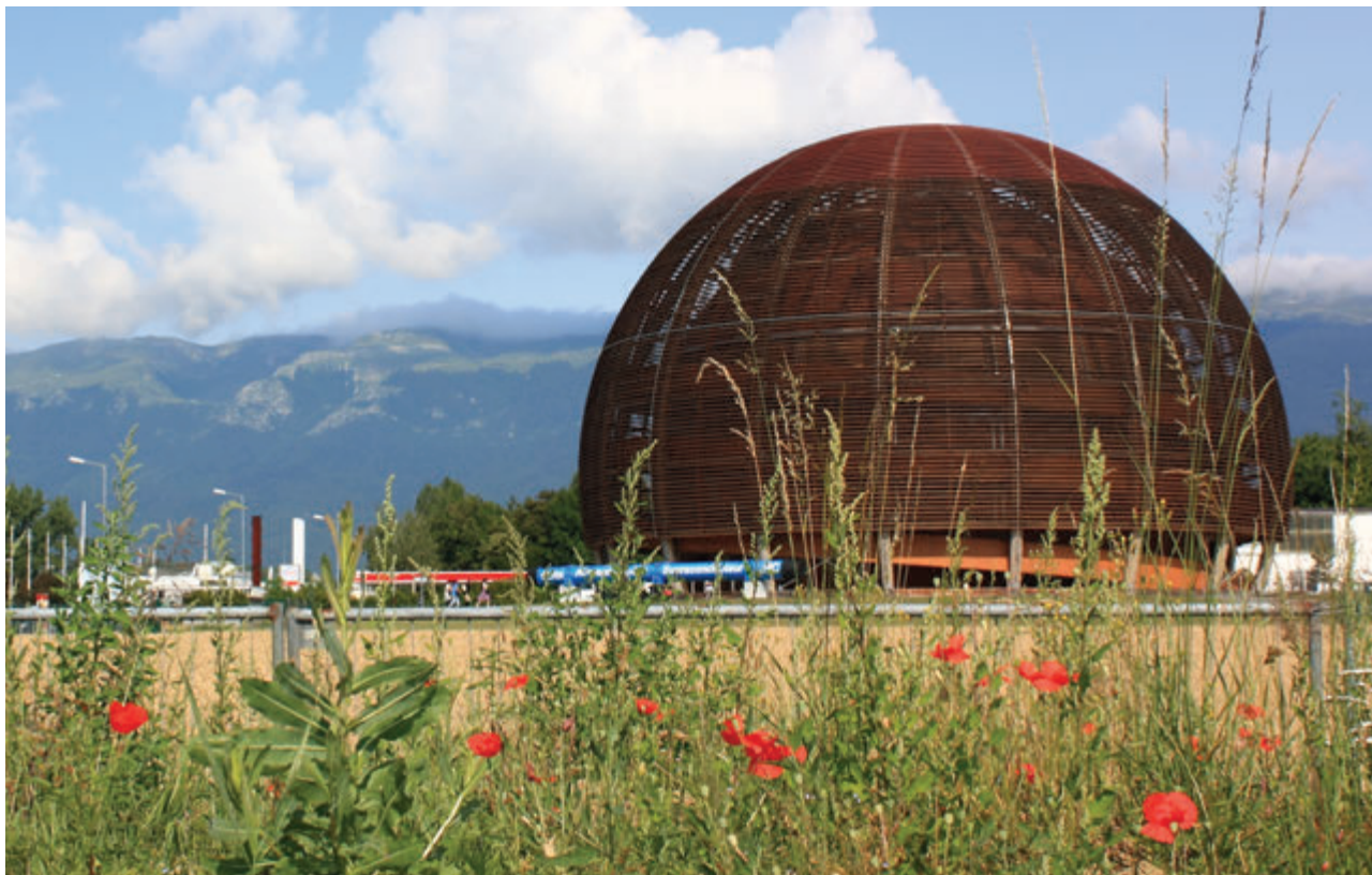
Fig. 1.4 Laboratorul de fizică de la Geneva (Accelerator la energii foarte mari)

astfel de facilități lucrează sute sau mii de fizicieni, iar investițiile sunt uriașe. Aceasta este modalitatea prin care fizica face progrese în zilele noastre.