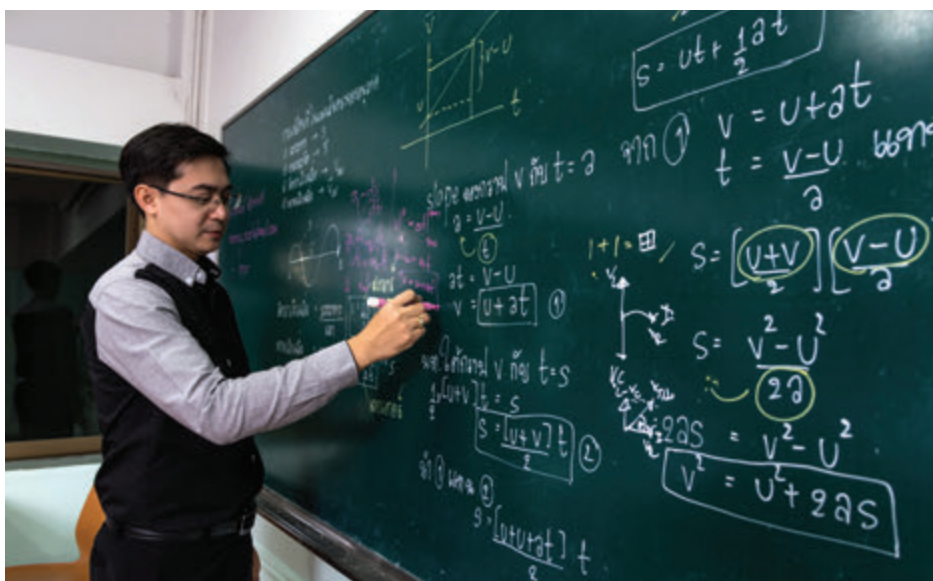
Fig. 1.1 Cu răbdare, muncă și pasiune, astfel de calcule vă vor dezvălui secretele Universului.

Numim știință (cunoaștere) un ansamblu de cunoștințe reunite prin faptul că se referă la același subiect. Acest subiect poate fi mai restrâns sau mai general. Voi studiați deja mai multe științe – matematica, biologia, iar acum fizica. Caracteristic științelor este faptul că ele se dezvoltă formulând reguli cu un caracter foarte general, numite legi, care se respectă în toate situațiile. Dacă o astfel de lege este vreodată infirmată de realitate, ea este abandonată sau suferă modificări în așa fel încât să respecte realitatea. Trebuie să înțelegeți că legile științei reflectă realitatea și nu impun realitatea. Realitatea naturii există indiferent dacă noi îi cunoaștem legile după care funcționează sau nu.