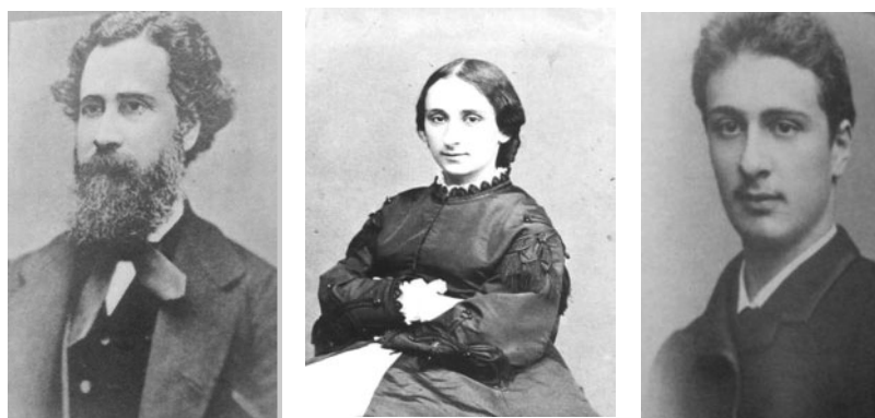
Ion C.Brătianu, Pia Brătianu și fiul lor, Ionel, la 16 ani

Ca urmare, în același an, Ionel este înscris în prima clasă a Liceului „Sfântul Sava” din București, unde „...s-a afirmat ca un școlar cu viziunea clară și cu serioase aptitudini de realist. Pentru liceanul Ionel Brătianu nu exista problemă fără soluție. Un spirit limpede și o minte ageră îl pregătise pentru misiunile pline de răspundere de mai târziu.”