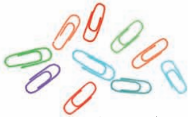
agrafe pentru hârtie