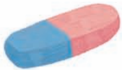
gumă de șters, radieră