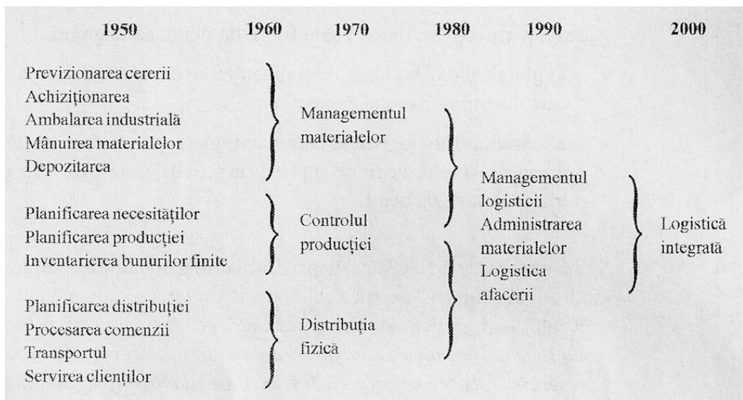
Figura nr. 1.2: Evoluția conceptului de "logistică"

În perioada dintre anii 1960 și 1970 , marcată de dezvoltarea sortimentelor produselor și îmbunătățirea serviciilor, logistica acoperea doar probleme legate de distribuția fizică, cererea de materiale și controlul stocurilor. Ca urmare, a apărut conceptul de logistică a afacerii definit ca (Radu, Specialistul în logistică 2013, 16):