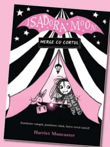
Merge cu cortul