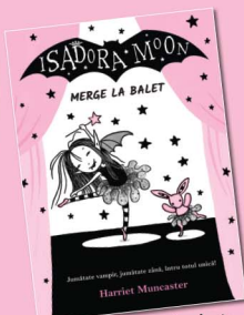
Merge la balet