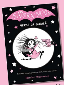
Merge la școală