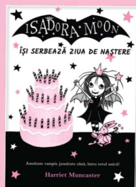
Își serbează ziua de naștere