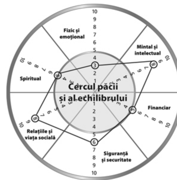
FIGURA 11.2 Un cerc dezechilibrat

Următorul pas este să conectezi punctele (cifrele pe care le-ai încercuit). Dacă ai obținut un cerc echilibrat, felicitări! Totuși, cei mai mulți oameni își acordă note mari în unele zone și mai mici în altele. Prin urmare, atunci când conectezi punctele, cercul lor nu este perfect rotund, ci mai mult sau mai puțin strâmb. În imaginea 11.2 poți vedea un exemplu de astfel de cerc.