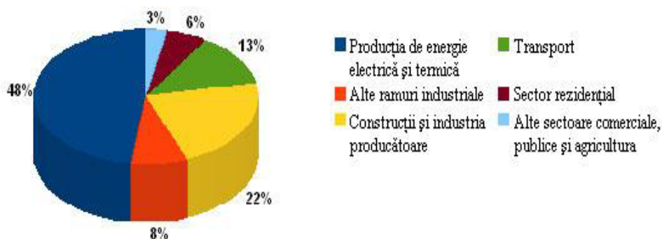
Fig. II. Ponderea emisiilor de CO 2 pe sectoare de activitate în România

În ceea ce privește România, emisiile de CO 2 generate din diferite sectoare de activitate evidențiază de asemenea contribuția majoră a sectorului energetic, a construcțiilor și industriei producătoare și a transporturilor, ceea ce înseamnă că acestea sunt domeniile asupra cărora sunt necesare implementarea unor măsuri și acțiuni de reducere a emisiilor de CO 2 și a celorlalte gaze cu efect de seră.