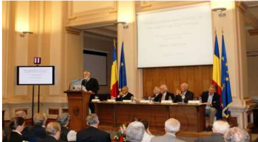
Dennis Meadows, co-autorul raportului "The Limits to Growth" la conferința anuală a Clubului de la Roma, București - BNR - 2 octombrie 2012

“Economia se va opri din creștere în mod natural, dar nu suficient de repede pentru a împiedica să se manifeste efectele schimbărilor climatice. Încetinirea va fi determinată, între altele, de: sărăcirea populației, femeile vor decide să nu mai aibă copii, ceea ce va duce la o reducere a consumului de resurse și la o economie de dimensiuni mai mici”. Ca soluții de încetinire a efectelor globale ale schimbărilor climatice, J. Randers susține: a) 2-4% din totalul angajaților pot trece din sectoarele economice tradiționale în cele verzi, chiar în condițiile păstrării tehnologiilor actuale; b) Să reorientăm fluxurile de investiții către sectoarele de care societatea are cu adevărat nevoie, nu către cele care sunt profitabile financiar [J. Randers].